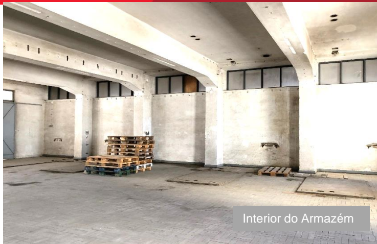
Interior do Armazém